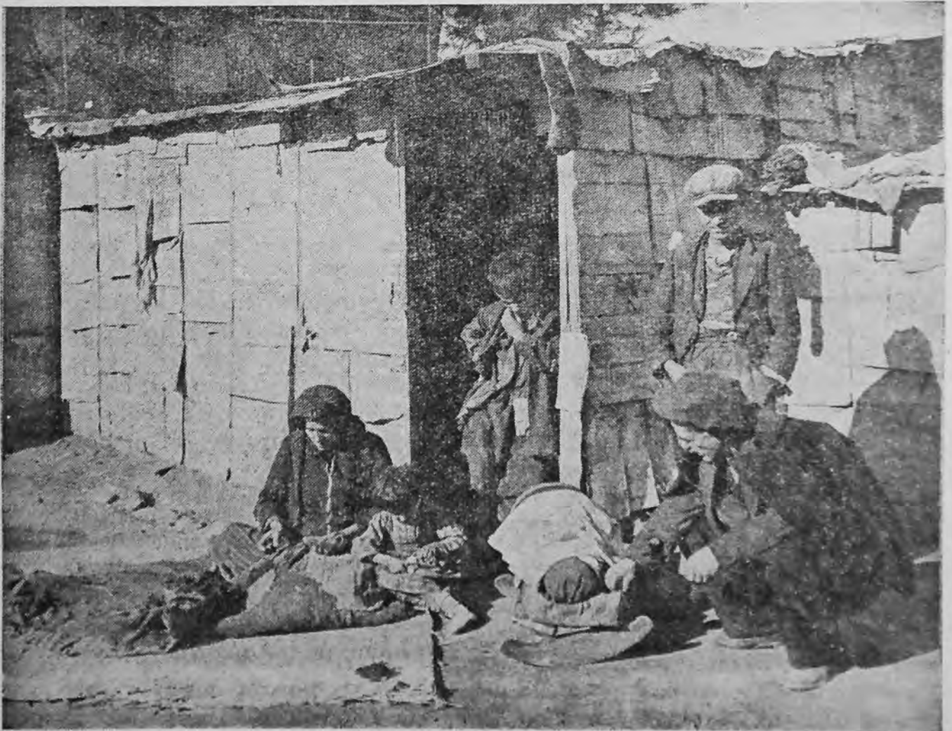
Μιὰ συνηθισμένη εἰκόνα τῆς νέας μας πρόσφυγιᾶς. Καὶ σκέπτεται κανεὶς, πῶς θὰ ἀντιμετωπίσουν τὸν χειμῶνα οἱ συμμοριόπληκτοι στὴν προχειρότατη τούτη παράγυα, τὴν κατασκευασμένη ἀπὸ τενεκέδες καὶ κουτιά.

Στὸ Καρπενῆσι, ἓνας τρελλὸς συμπαθητικὸς γέροντας, περιφέρει καὶ αὐτὸς μιὰ φωτογραφία μὲ τὰ ἑπτὰ παιδιὰ του. Κανένα ἀπ' αὐτὰ δὲν ξέρει ἂν ζῆ καὶ πῶς ζῆ. Καὶ ἔχει τὴν ἐπιθυμία νὰ δῆ τὴν φωτογραφία