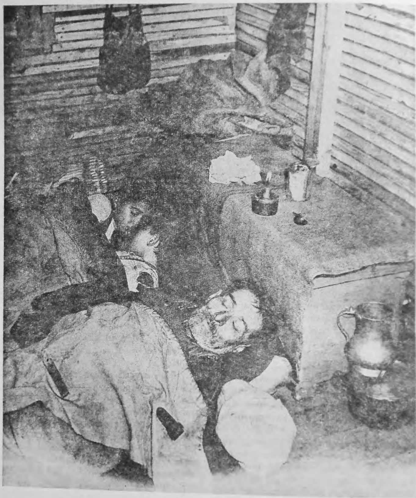
“Ωρα ύπνου στον καταυλισμό «Αναγέννησις» (Ίωάννινα). Ο γέροντας και τὰ παιδιά κοιμούνται τώρα ήσυχoi σὲ μιὰ γωνιὰ τῆς παράγγας. Ἡ φωτογραφία δὲν δείχνει καὶ τὶς ἄλλες γωνίες πού ἔνδεκα ἄλλα ὄτομα κοιτῶνται σ’ αὐτές. Οἱ δεκατέσσερις ἔνοικοι τοῦ ἑνὸς δωματίου ἀνήκουνσὲ δυὸ οἰκογένειες ἀπὸ τὸ Μακρόπουλο καὶ τὰ Ζαβρόσια Πωγωνίου.